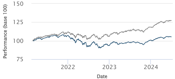
— Profil Harmonie — 25% MS World + 25% EuroStoxx50 + 50% ESTR

Les performances passées ne préjugent pas des performances futures et ne sont pas constantes dans le temps. Les performances de ce profil de gestion sont nettes de frais de gestion du contrat et de frais au titre de la Gestion Pilotée du contrat d'assurance vie (frais prélevés trimestriellement) et nettes de frais de gestion propres aux supports en unités de compte, avant prélèvements sociaux et fiscaux.