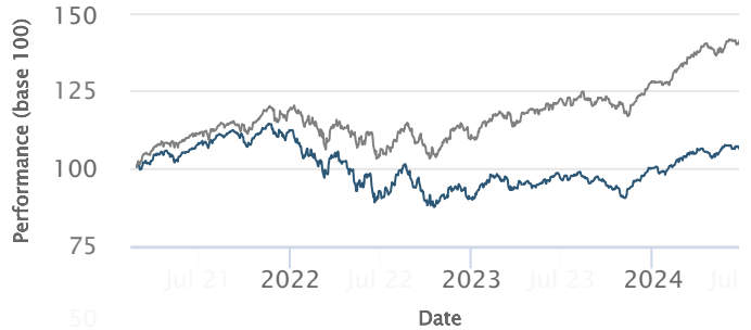
— Profil Audace — 40% MS World + 40% EuroStoxx50 + 20% €STR

Les performances passées ne préjugent pas des performances futures et ne sont pas constantes dans le temps. Les performances de ce profil de gestion sont nettes de frais de gestion du contrat et de frais au titre de la Gestion Pilotée du contrat d'assurance vie (frais prélevés trimestriellement) et nettes de frais de gestion propres aux supports en unités de compte, avant prélèvements sociaux et fiscaux.